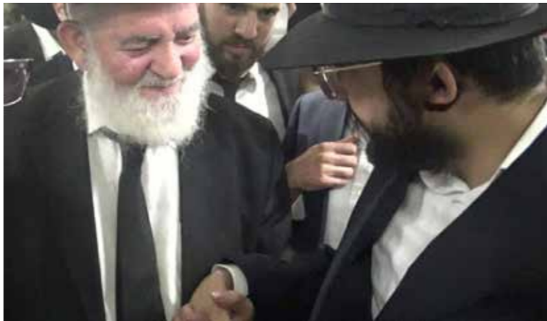
הערכה עצומה. עם חשובי הרבנים