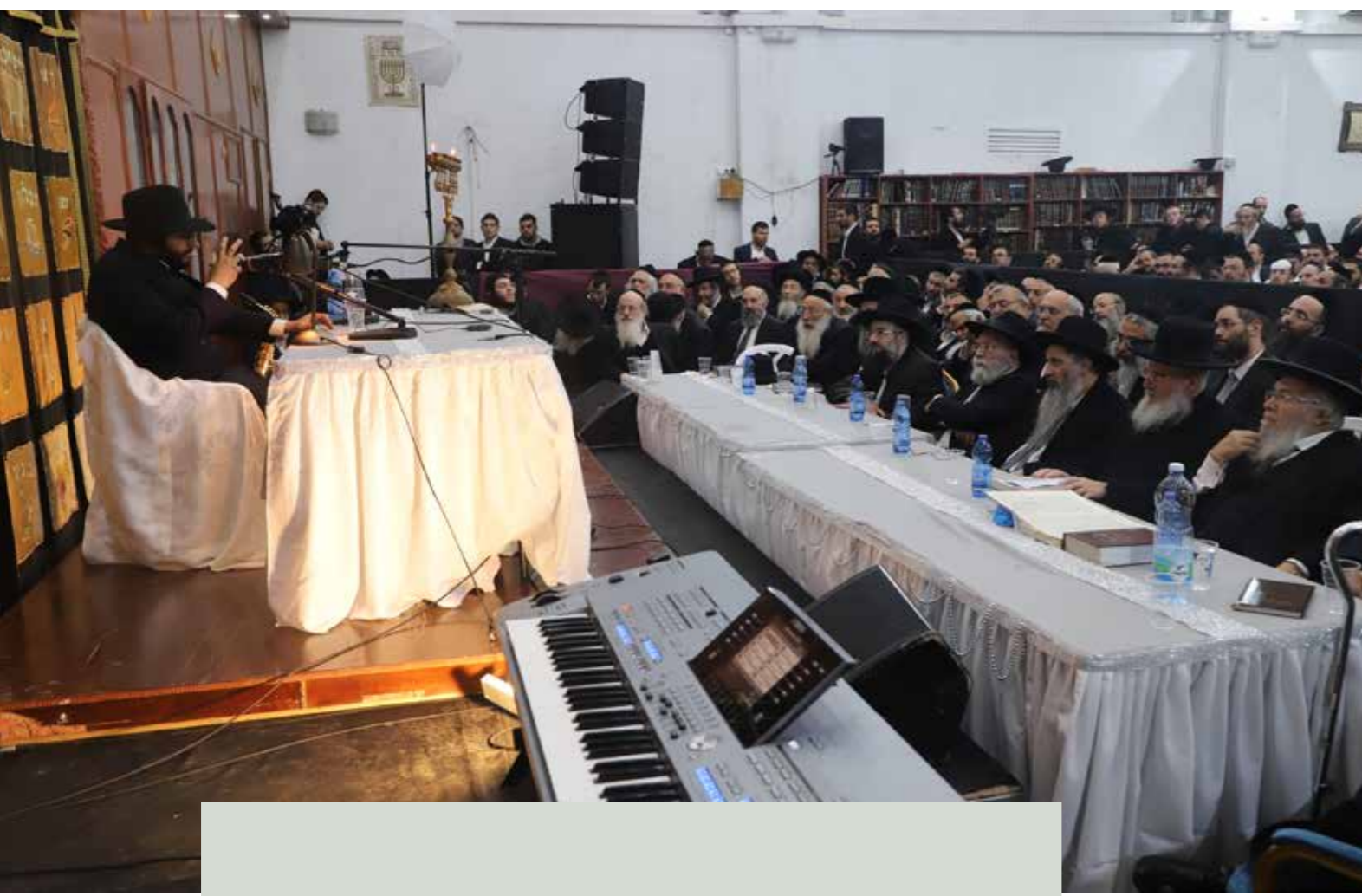
ידע נגן. הפסנתר שמוכן לרגעים שאחרי הדרשה