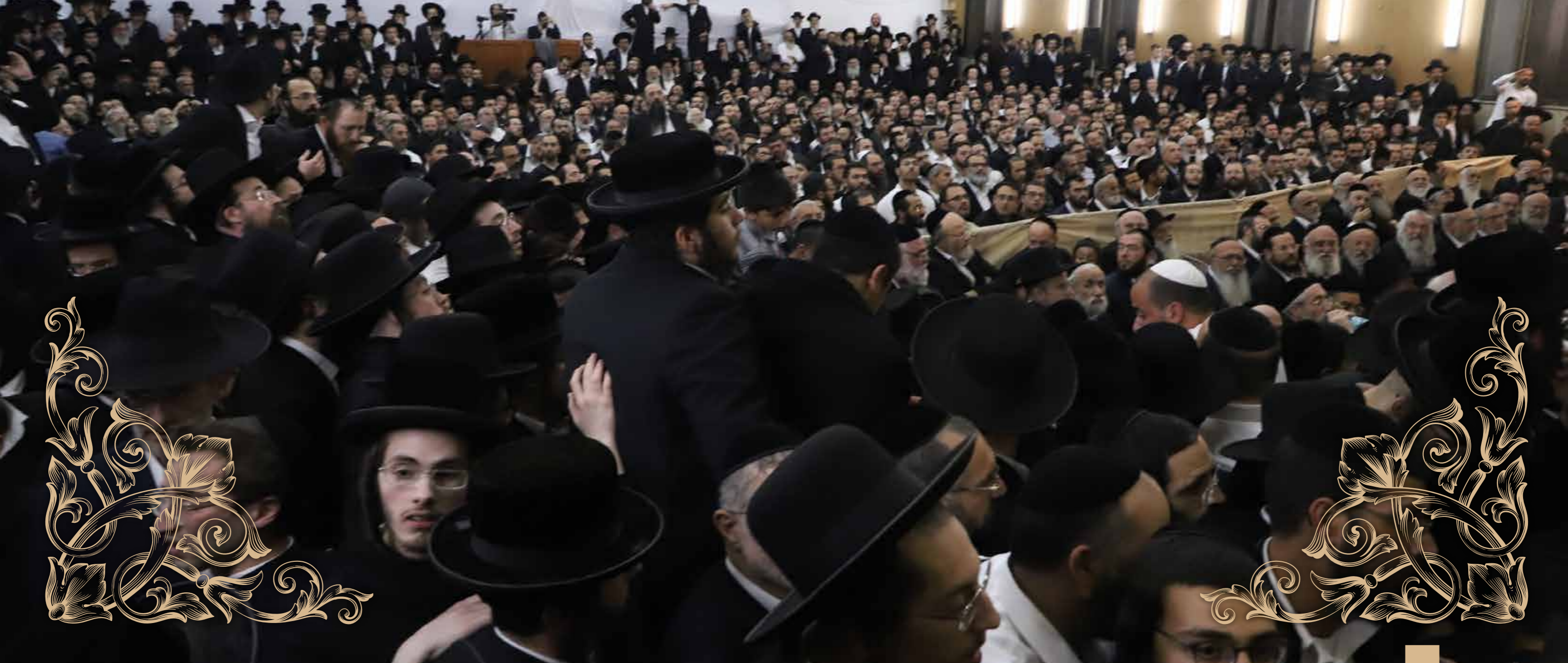
תופעה מאלפת. המונים נקהלים לשיעור מה'ינוקא' בחורף האחרון

אתו השומעים מטפסים לגבהים. הוא פותח את דבריו בביאור שורש הניסים שהיו בכל דור ודור. משם מסתעפים הדברים לעומק פנימיות דיני טומאה וטהרה. אחר כך הוא מנווט את הספינה הגדולה לנקודה של כבוד צלם אלוקים שבכל אדם. המושגים רצים כמו בסרט נע, המקורות גם הם מתחלפים בקצב מסחרר, והשומעים, הם אינם יודעים את נפשם. חשוב לו שהם ייצאו עם מסר ברור. שלא יהיו דברי תורתו כהלכה שאין עמה מעשה. לכן הוא מעודד אותם כדרכו למידות טובות: "כל האסונות יורדים לעולם רק בגלל שלא מכבדים אחד לשני. צריך לכבד כל אחד ואחד ובפרט הורים, חכמים וזקנים". הניגודיות שבין העמקות והבקיאות שבה פותח את דבריו לבין המסרים הפשוטים עליהם הוא חוזר הלכה למעשה היא בולטת. דווקא בשלהם הוא מוכן למסור את השיעור, ולצאת ממקומו הטבעי והמסתגר. הוא אינו בא לכאן כדי לחולל מופע קסמים תורני. המטרה שלו אחת: