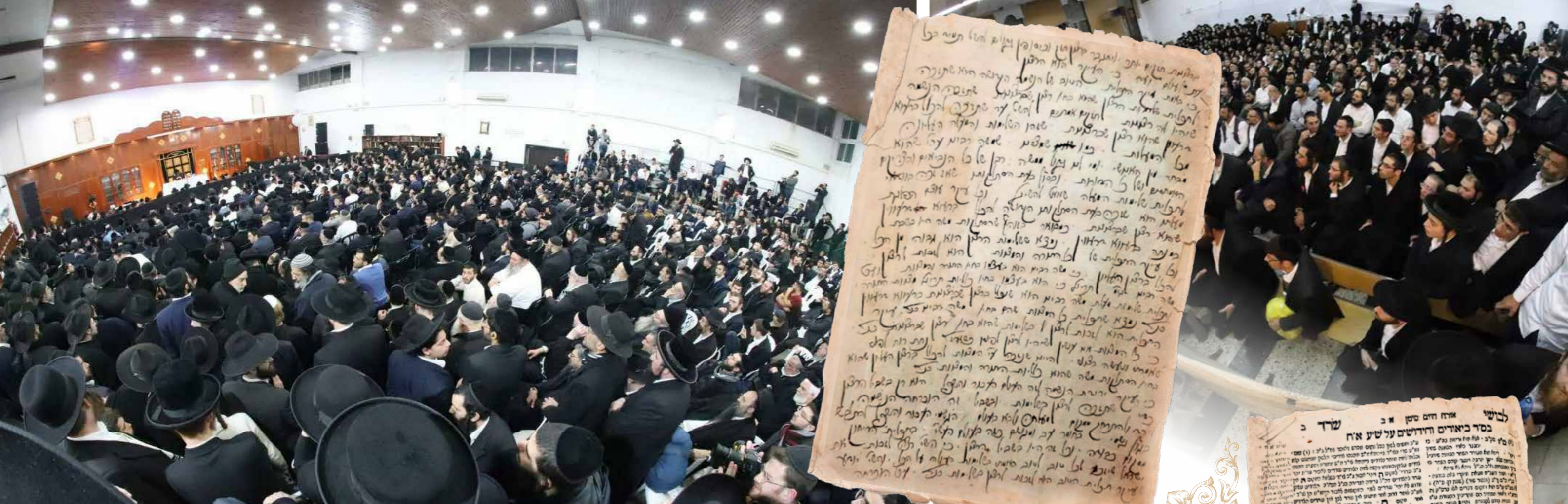
קהל אדיר. באחד השיעורים בחורף האחרון