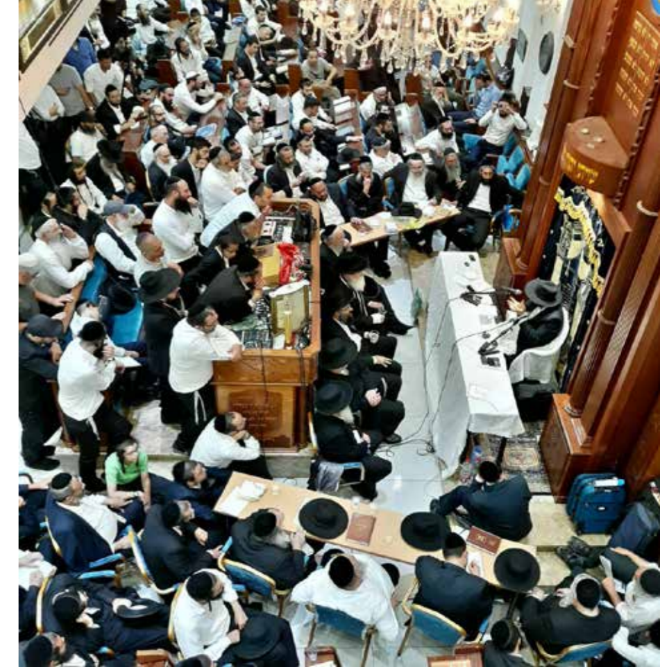
עם הגר"ש בעדני (למעלה) והאדמו"ר מפינסק קרלין (למטה)