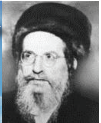
רבינו בעל הסולם נשמת האריז"ל בדורינו